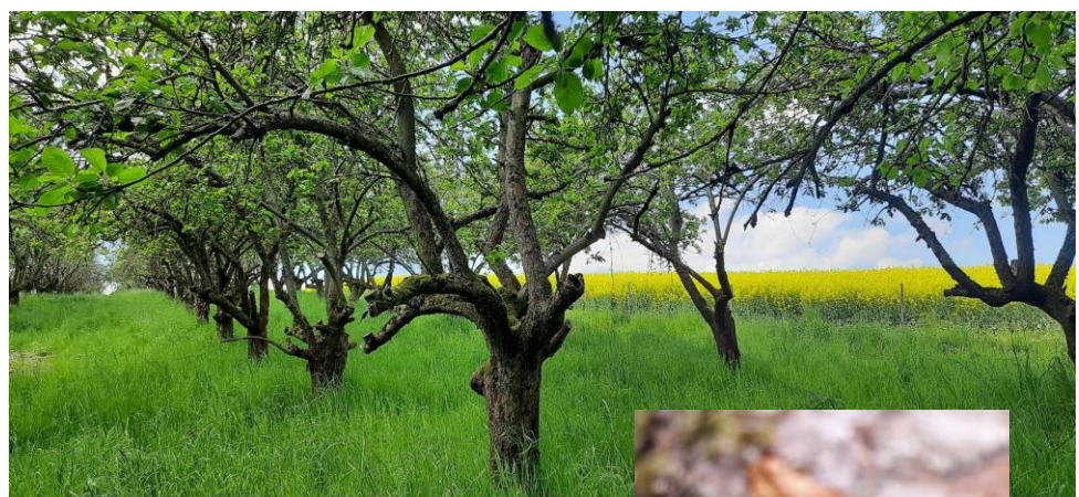
Streuobstwiese Schrebitz, Mai 2022