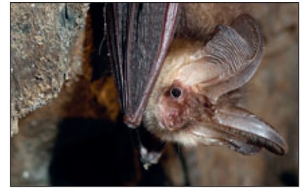
Foto: Langohr-Fledermaus